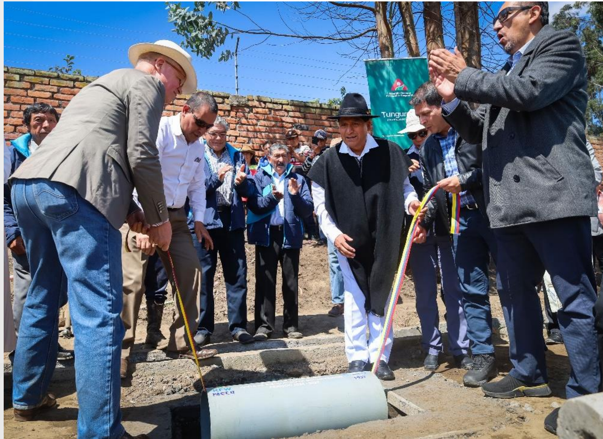
Proyecto Mocha Huachi