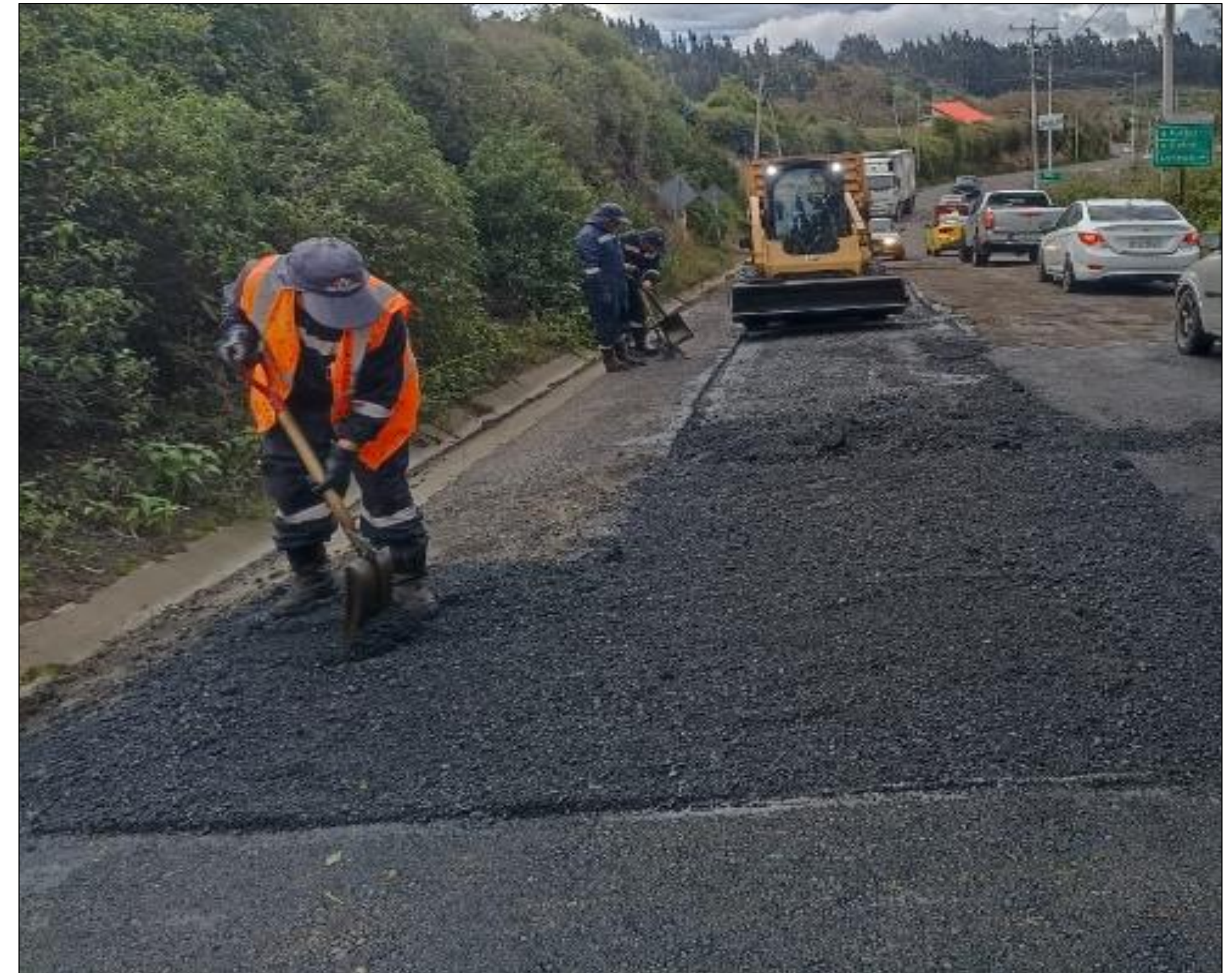
Bacheo: VÍAS DE MOCHA EL PORVENIR PINGUILÍ-QUEROCHACA