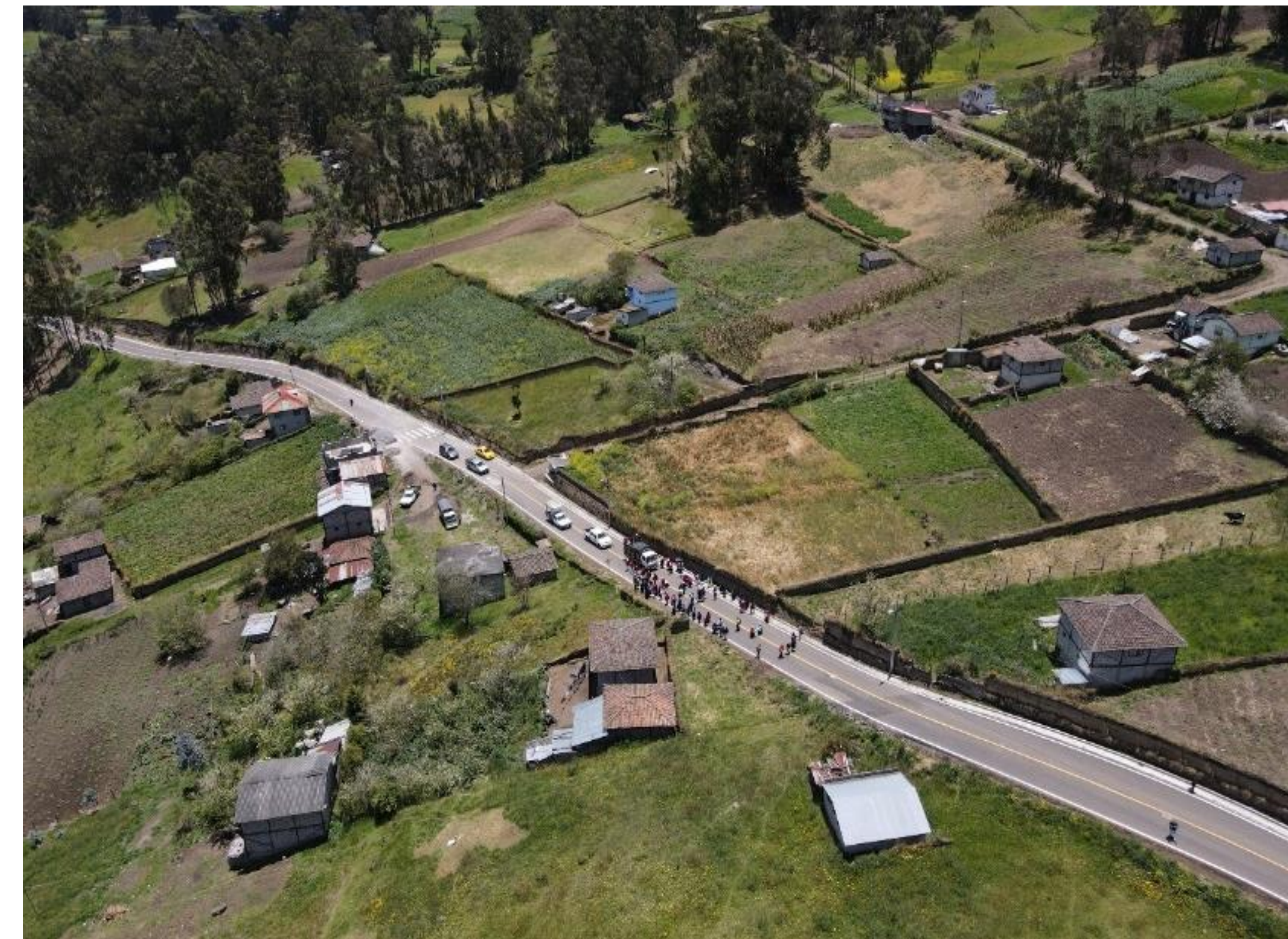
VÍA EL ROSARIO - SALASAKA