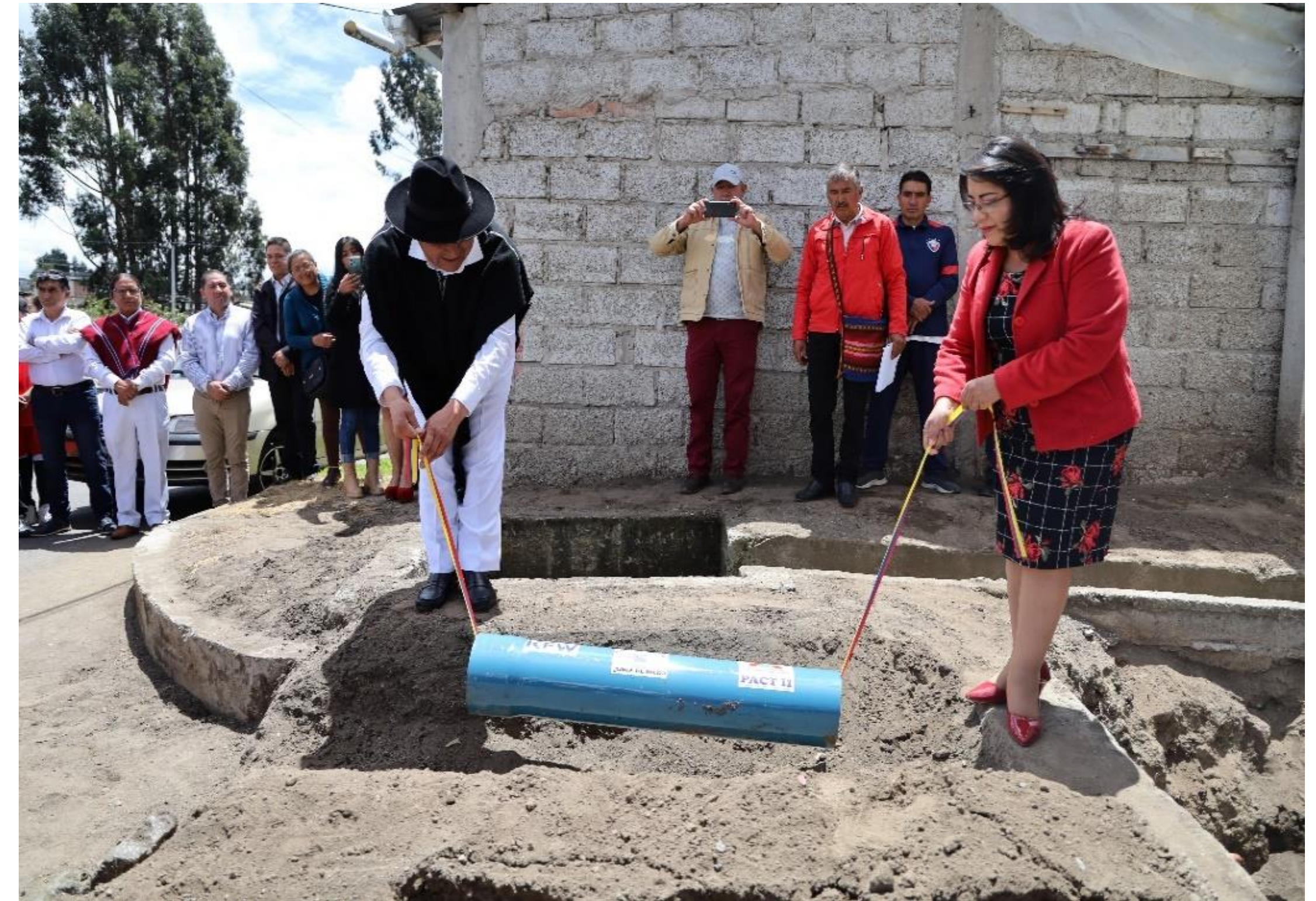
Proyecto Toallo Alobamba