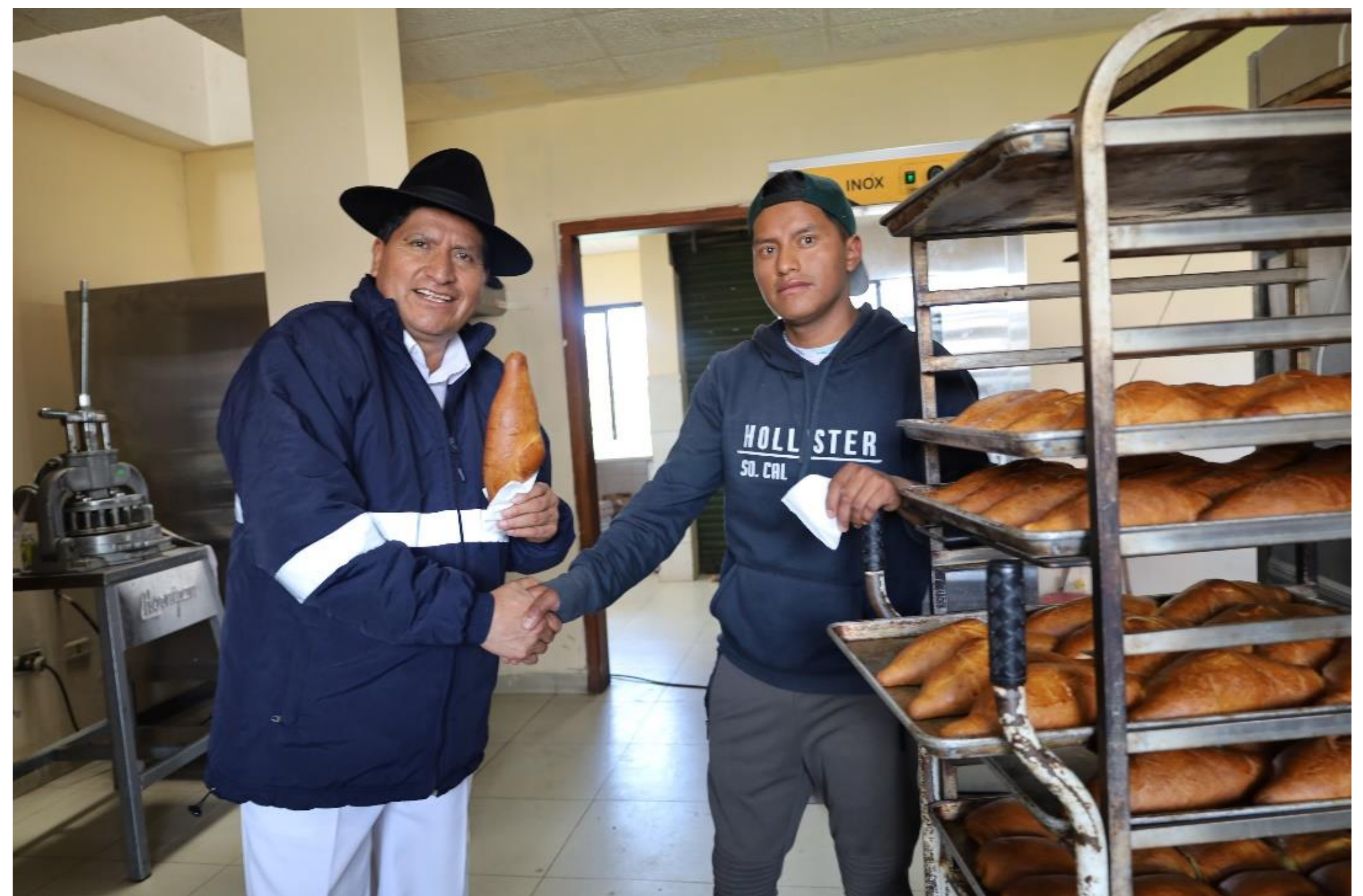
Emprendimientos locales - Producción de machica Calhua Chico