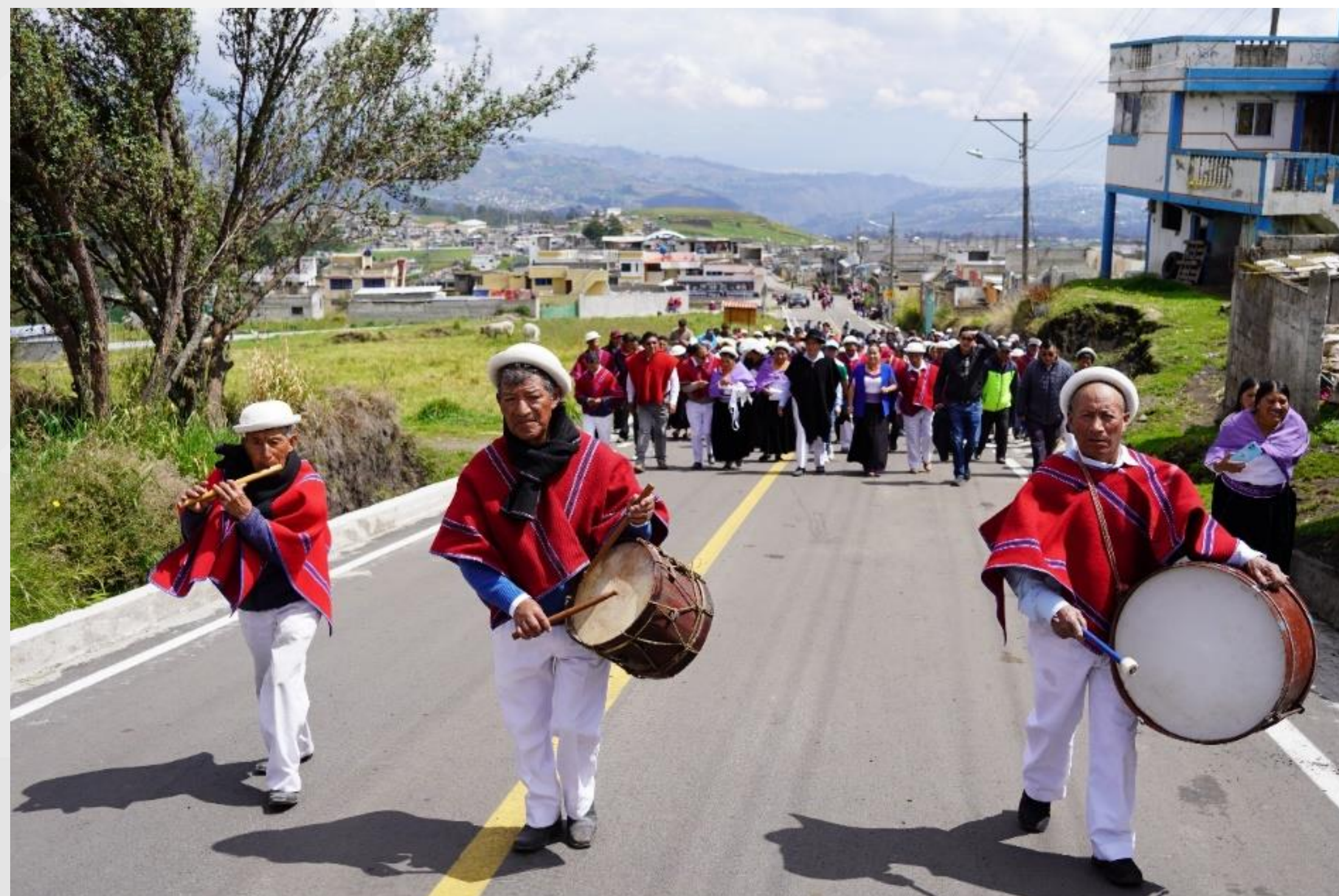
PUCARÁ – PILAHUÍN