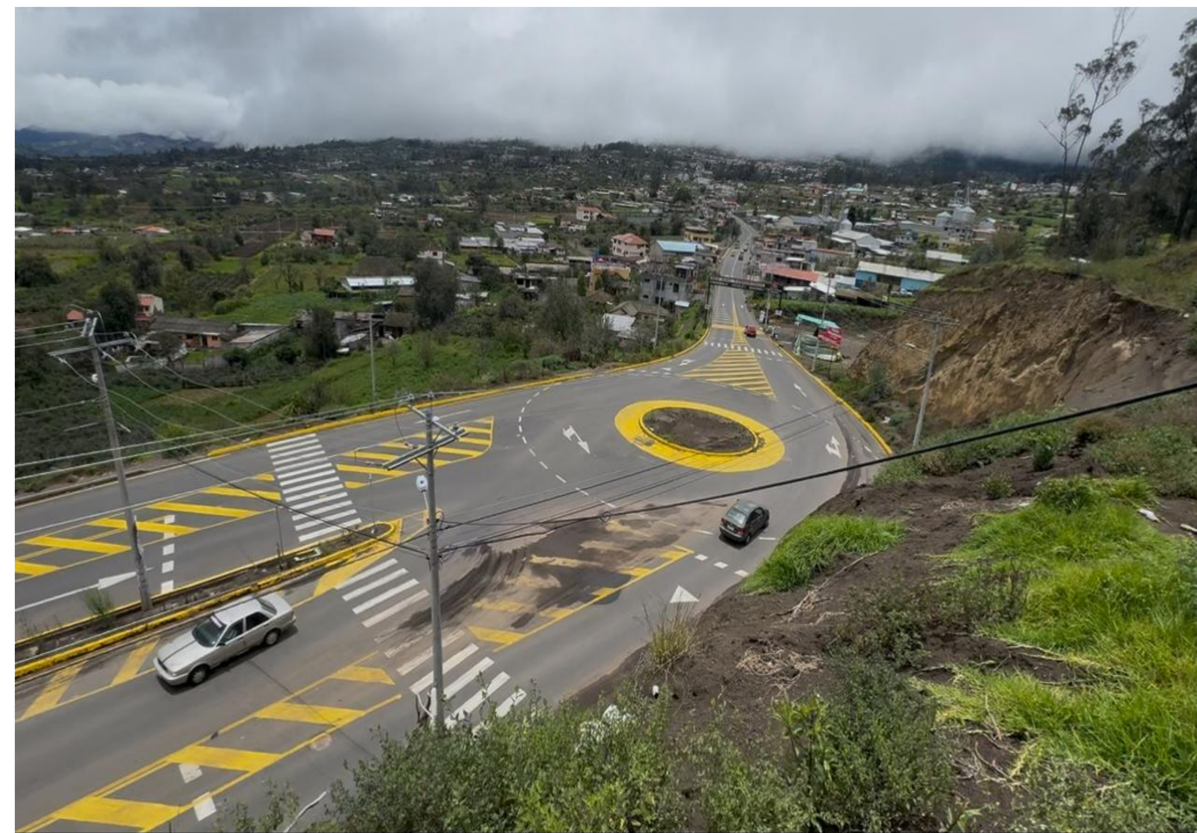
ASFALTOS HUAMBALÓ, COTALÓ, BOLÍVAR