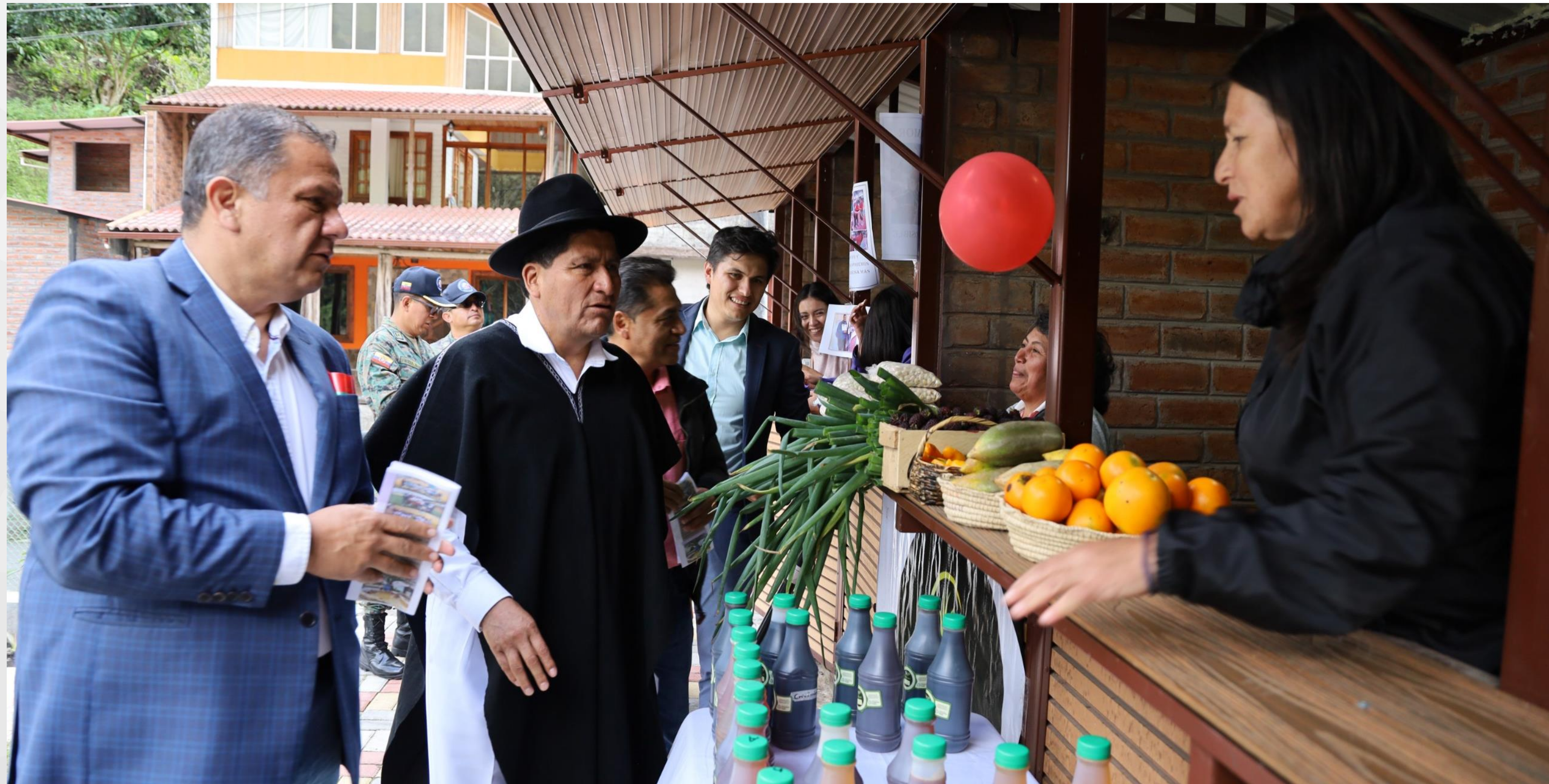
KIOSKOS PARQUE LA CIÉNEGA - ULBA BAÑOS – (REPRESA AGOYÁN)