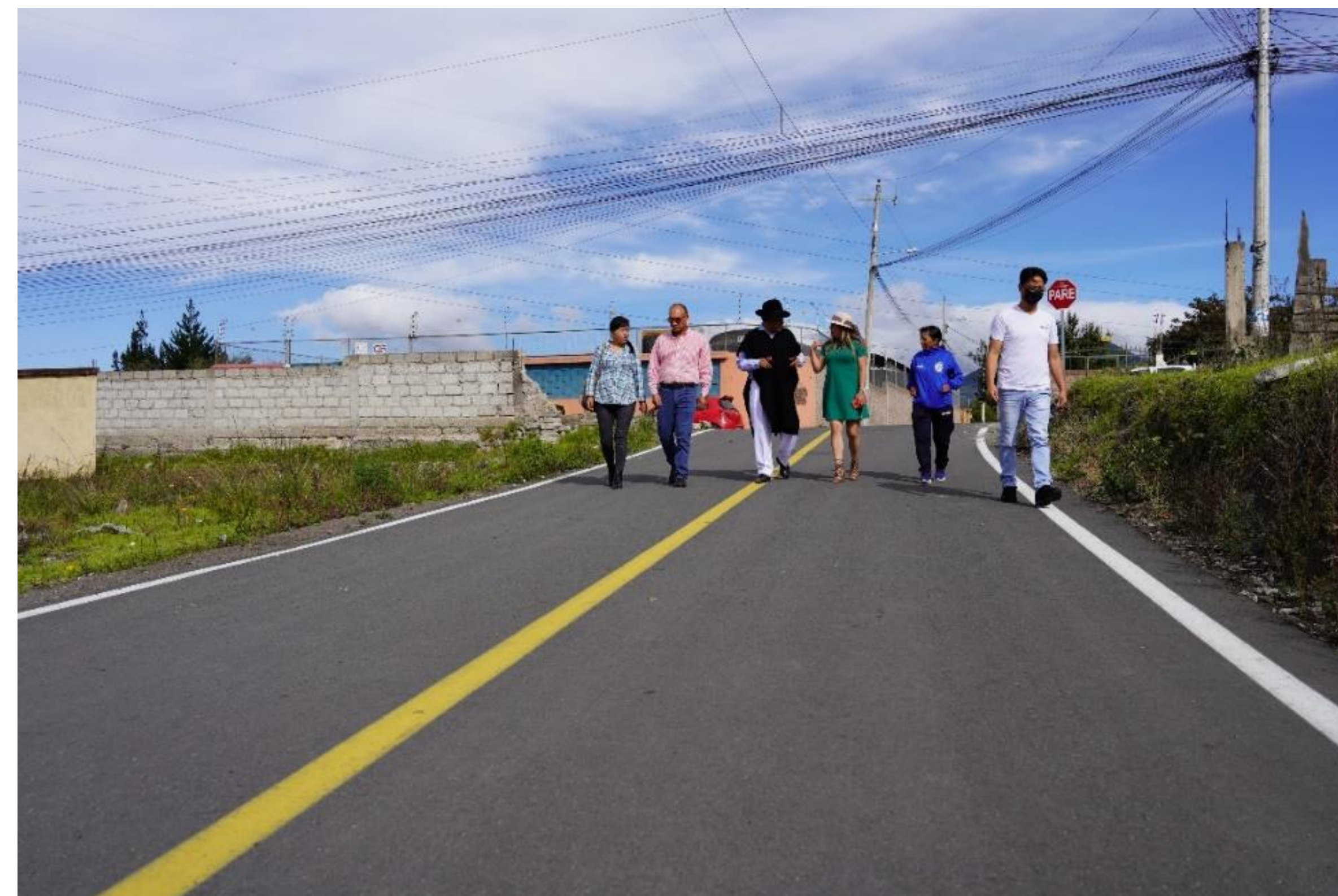
LA LIBERTAD – PARROQUIA TOTORAS