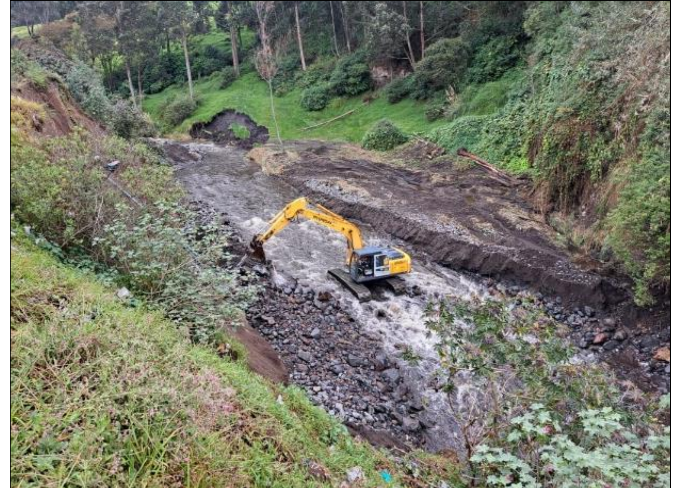
Encausamiento de Río Pachanlica- Totoras