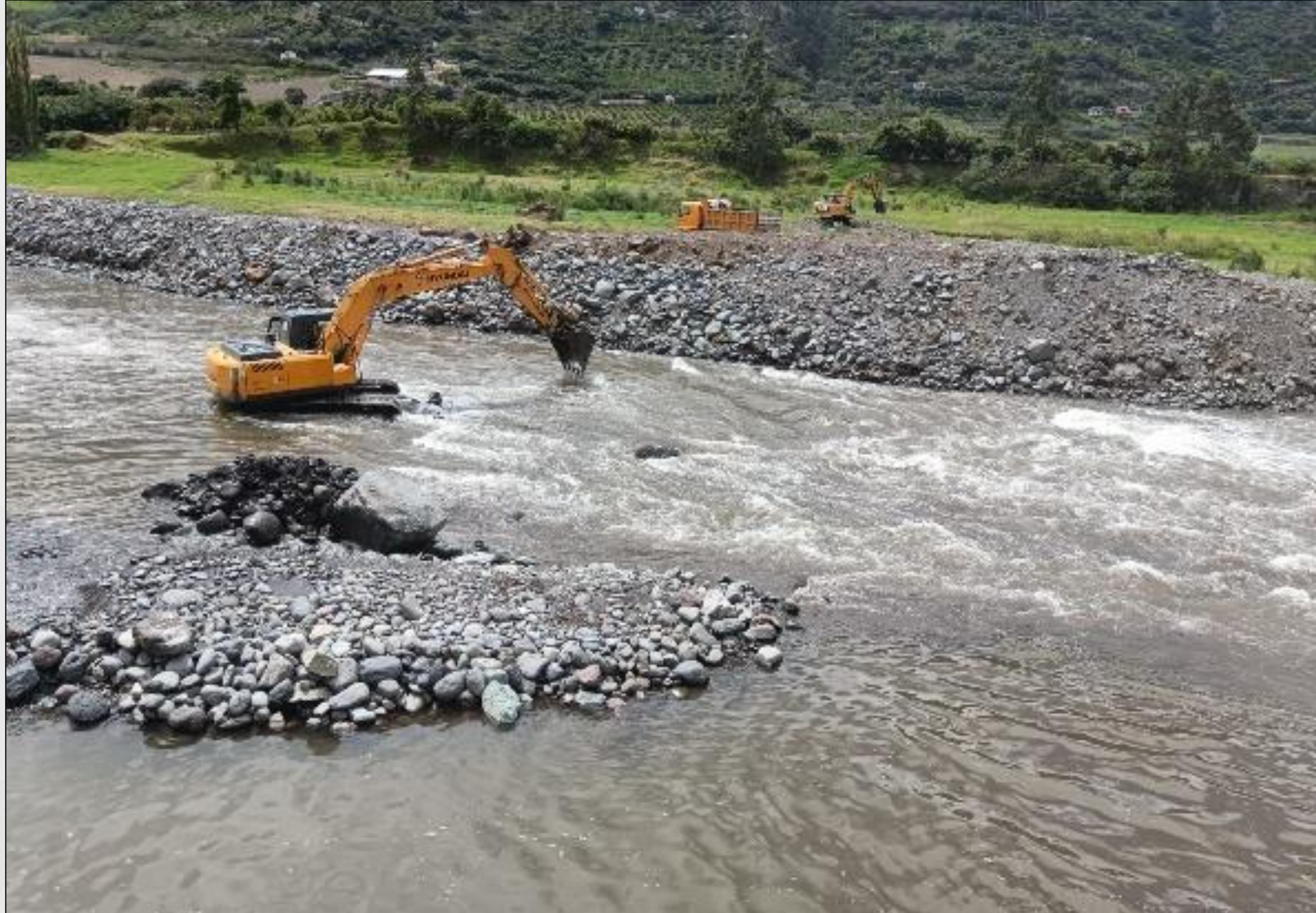
Encausamiento de Río Patate - El Cauvi