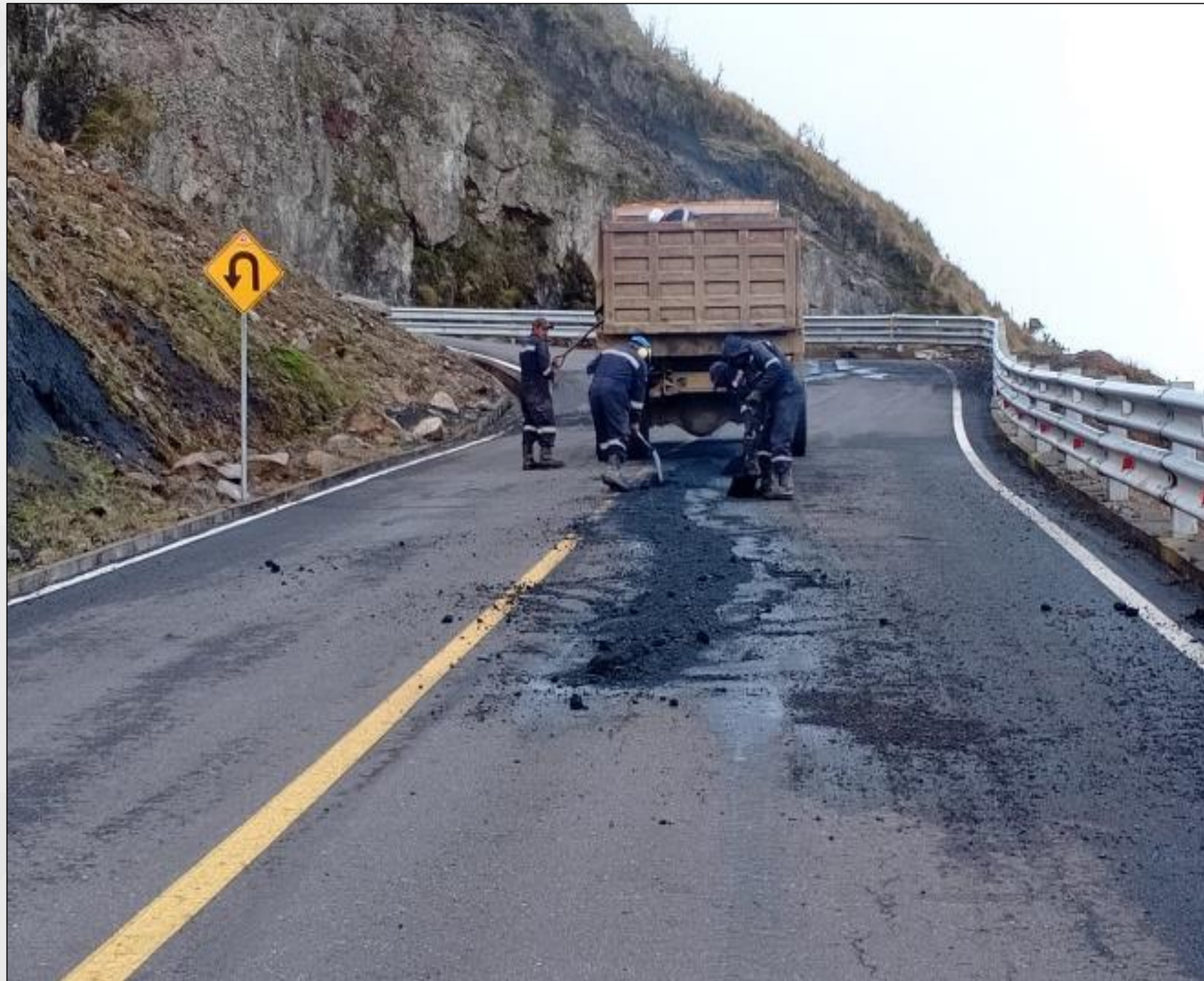
Bacheo: VIA PASA-TILIVÍ-MULACORRAL