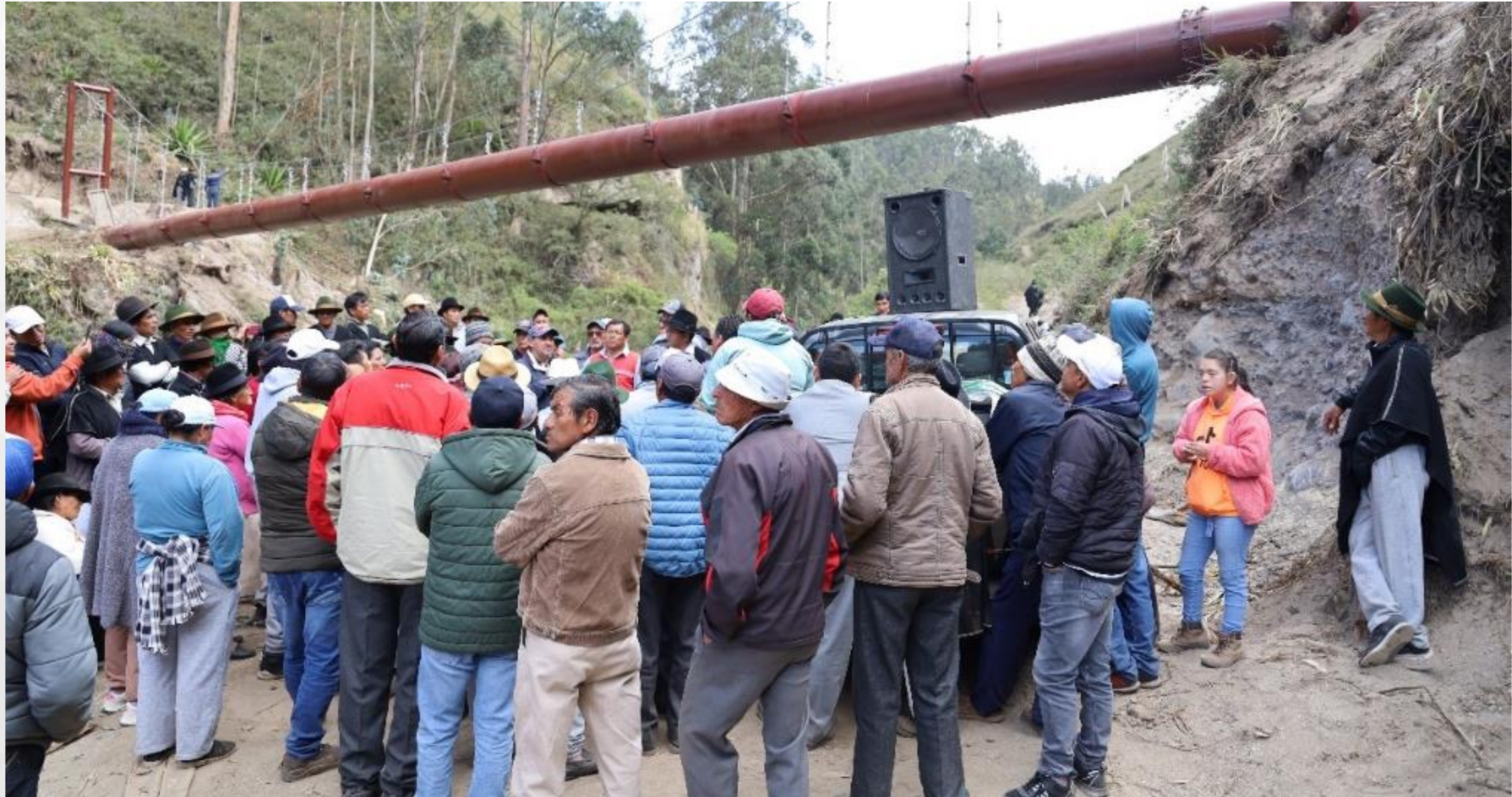
Paso elevado Canal de Riego Ambato Huachi Pelileo - Jun - Jun