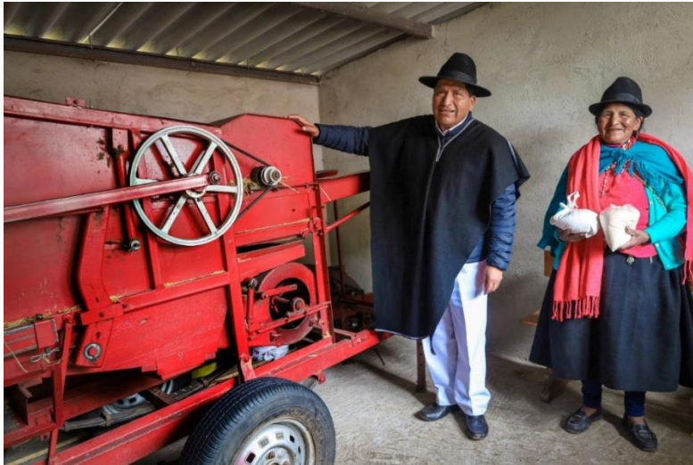
PRODUCCIÓN DE MÁCHICA CALHUA CHICO – CANTÓN AMBATO