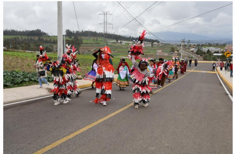
DIVINO NIÑO - IZAMBA AMBATO