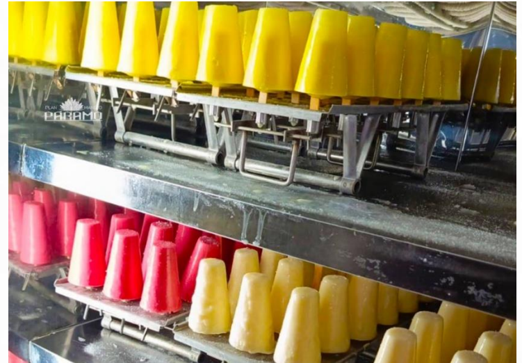
FÁBRICA DE HELADOS TELIGOTE CANTÓN - PELILEO