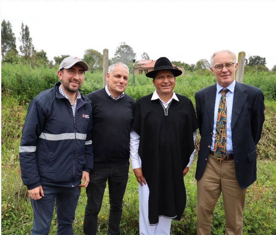
PROYECTO ACEQUIA - MOCHA HUACHI