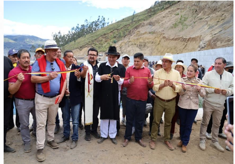
TANQUE DE ALMACENAMIENTO –ACEQUIA EL PORVENIR - GARCIA MORENO –PELILEO