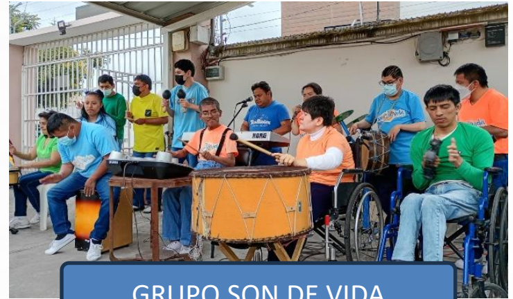
GRUPO SON DE VIDA