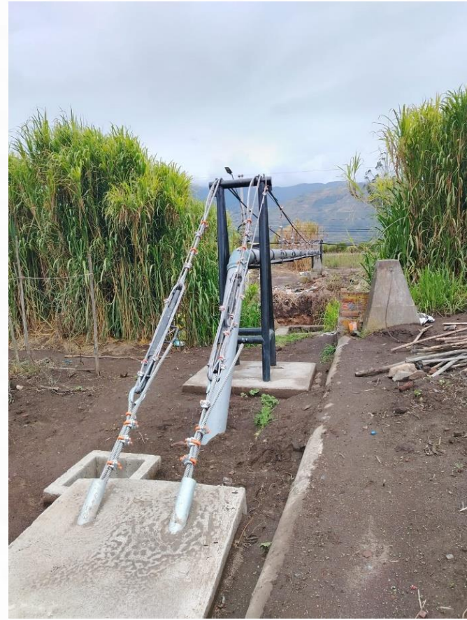
PASO ELEVADO – ACEQUIA LA MOYA - PELILEO