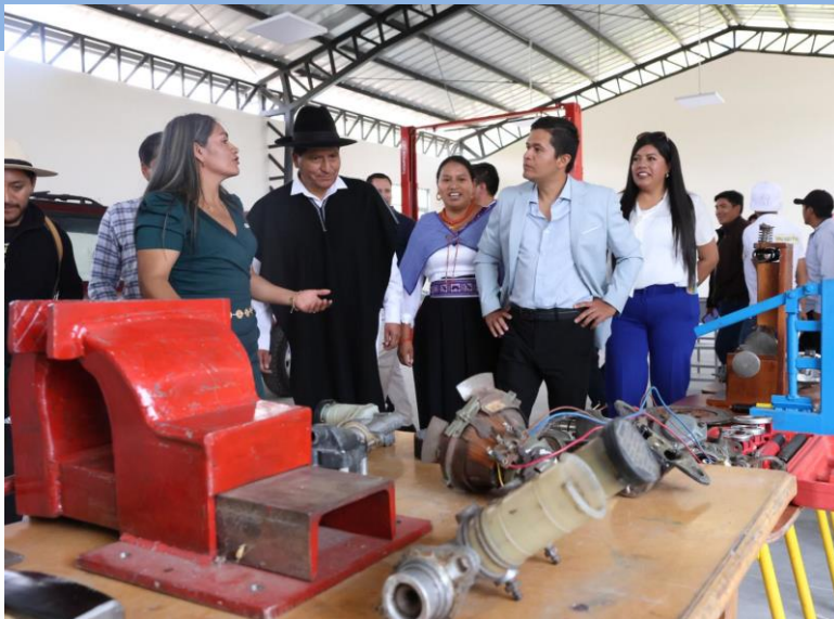
TALLERES ALTERNATIVOS COLEGIO SUCRE – CANTÓN PATATE