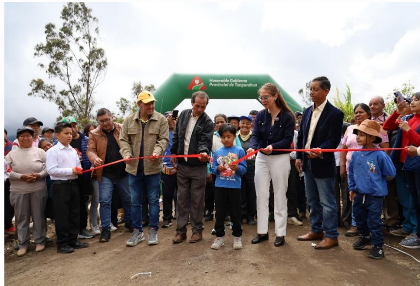
CANAL SALATE – PELILEO