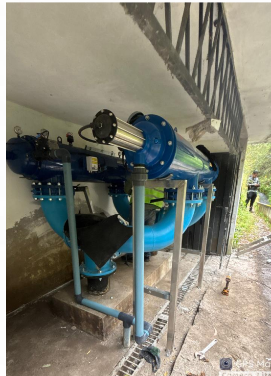
PROYECTO JUNTA DE RIEGO TOALLO -ALOBAMBA