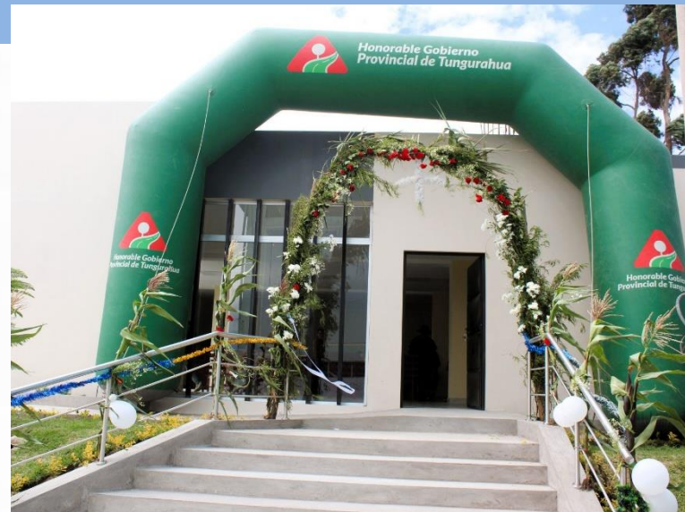
CENTRO DE CAPACITACIÓN VARGASPAMBA-SALASAKA PELILEO