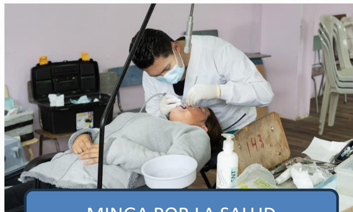
MINGA POR LA SALUD