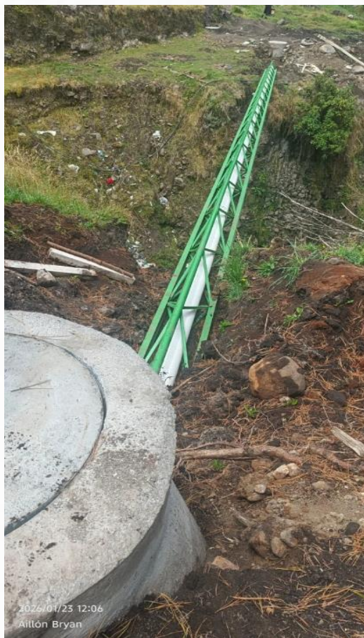
Alcantarillado sectores de Yagualyata y San Cayetano de la comunidad de Tamboloma