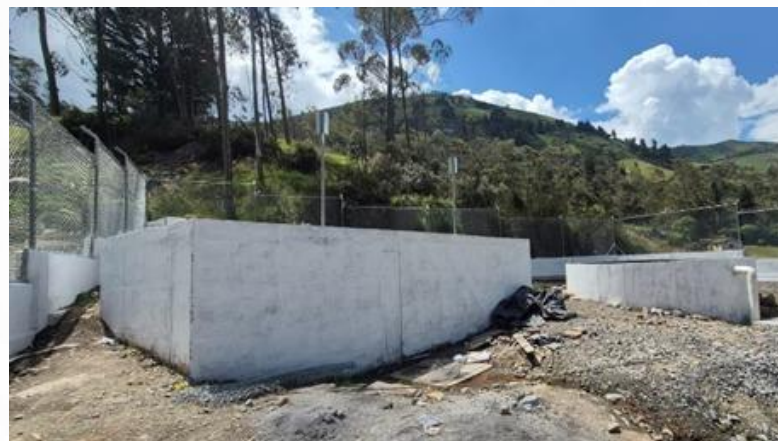
Planta de tratamiento de aguas servidas