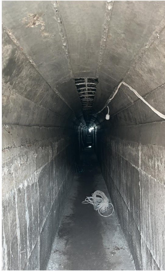
TUNELES CANAL – CASIMIRO PAZMIÑO - AMBATO