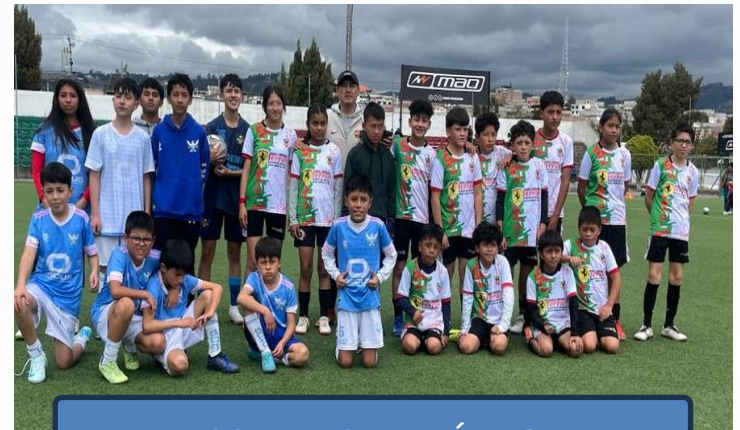
ESCUELAS DE FÚTBOL